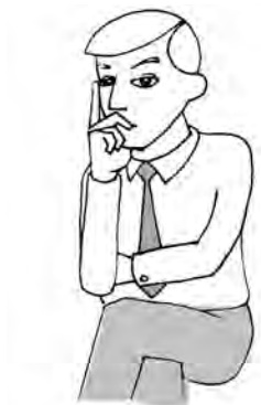
Îți pierzi vremea cu tipul ăsta!

Ca să ne demonstrăm teoria, iată un ansamblu tipic de gesturi de evaluare critică folosit atunci când o persoană nu este impresionată de ceea ce aude: