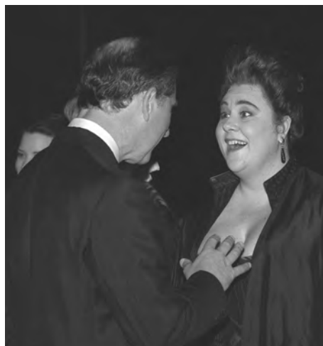
Prințul Charles și noii lui „prieteni“

holbeze la sânii ei, în vreme ce în mod inconștient și concomitent să facă gesturi de pipăire.