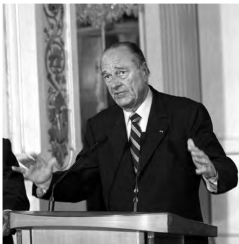
Președintele Jacques Chirac, aproximând dimensiunea unei anumite chestiuni sau pur și simplu laudându-se cu viața lui amoroasă?