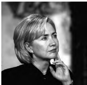
Hillary Clinton folosește acest ansamblu de gesturi atunci când nu este convinsă.

Semnalul principal de evaluare critică este gestul prin care se aduce mâna la față, cu degetul arătător îndreptat în sus, pe obraz, degetul mijlociu trecut peste gură și degetul mare sprijinind bărbia. O altă dovadă că ascultătorul nu are o părere bună despre ceea ce aude reiese din poziția picioarelor și a brațelor, pe care le ține strâns încrucișate (defensiv), în vreme ce capul și bărbia sunt îndreptate în jos (negativ/ostil). „Propoziția“ corporală transmite ceva de genul: „Nu-mi place ce spui“, „Nu sunt de acord“ sau „Am reticențe față de ceea ce spui“.